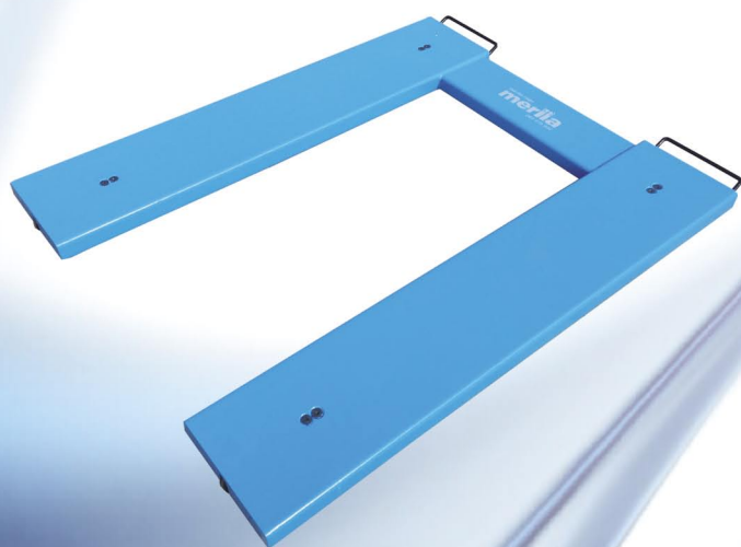
model AMI-P sa farbanom konstrukcijom

Specijalna vaga za merenje paleta, laka za premeštanje. Pogodna sa merenje u svim komercijalnim i industrijskim okruženjima gde je potrebno brzo merenje tereta. Opremljena sa četiri merna pretvarača sile od nerđajućeg čelika. Odobrenje tipa broj RS-16-015.