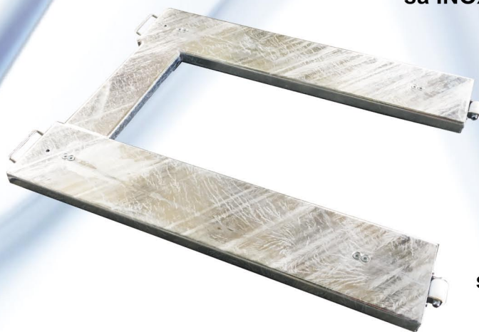
model AMI-P sa toplocinkovanom konstrukcijom